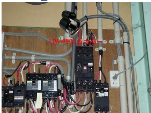
分電盤または制御盤の幹線部 (元付け用LOA)