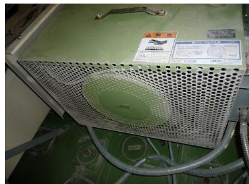
乾燥機吸気バーナー一部 (汎用LOA)