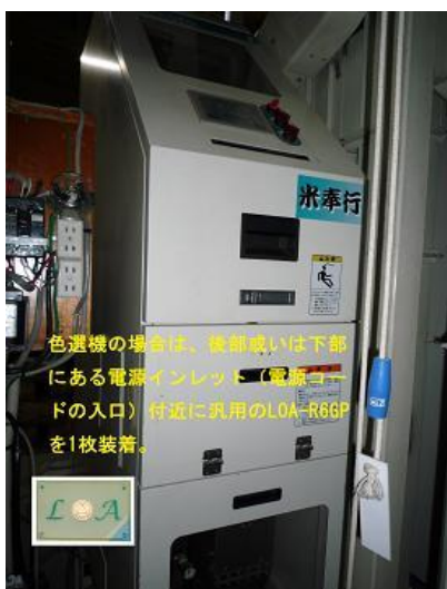
色選機電源インレット部 (汎用LOA)