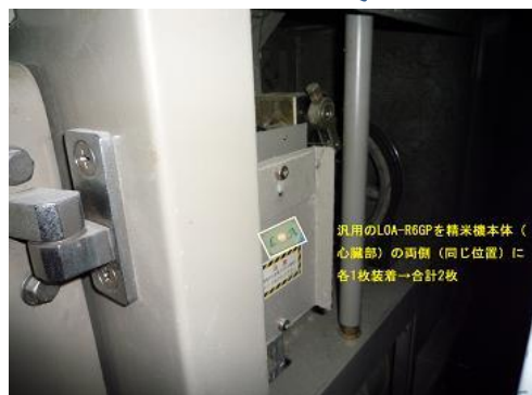
精米機本体の胴体両側 (汎用LOA2枚)