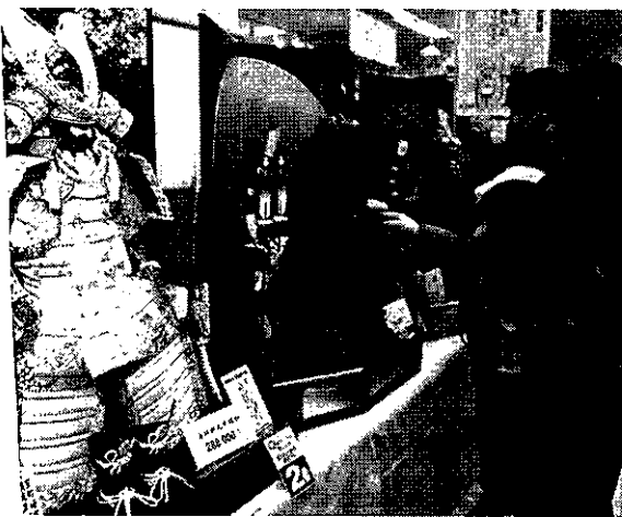
立派な鎧飾りや兜飾りが並ぶ店内

また、こいのほりも色、柄、素材の違い約50種類を用意。マンシヨン用、室内用などさまざまな。中にはユニークな「出世ごまのほり」も。こしは「がんばろう!日本」『絆』吹流しや、寄せ書きができるこいのほりもある。 営業は午前10時から午後7時。問い合わせは090(電)1117-8128