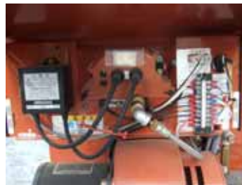
LOAの取り付け状況(バーナー付近)